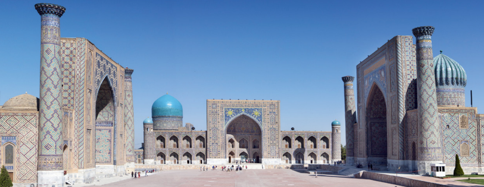
Samarkand, Registan