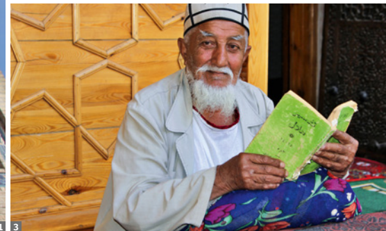
1 Samarkand, Grab von Timur © Anton Eder 2 Moynaq am Aralsee, jetzt Aralkum © Ernst Martinek 3 Mann aus Chiwa © Anton Eder

große Aral-See – ehemals mit 68.000 km 2 viertgrößter Binnensee der Welt – nach und nach austrocknete und die Wüste Aralkum zurück ließ. Im ehemaligen Fischerdorf Moynaq treffen wir auf die letzten Reste des Aral-Sees und sehen die Überbleibsel der ehemals stolzen Fischfangflotte, die in der Wüste strandeten. Rückfahrt nach Nukus.