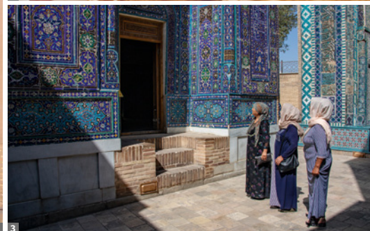
1 Chiwa: Minarett Kalta Minar und Festung Kunya Ark 2 usbekisches Brot 3 Samarkand

Erlebnisreise mit Flug, Bus/Kleinbus, *** und ****Hotels/meist HP