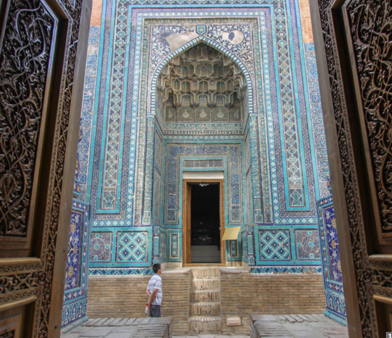
1 Samarkand © Anton Eder 2 Tatar Schlucht © Anton Eder