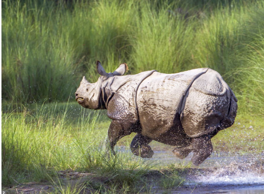
1 typischer Dachträger der Newari-Häuser 2 Panzernashorn im Chitwan-NP