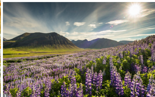
1 Námaskarð, Mývatn 2 Seljalandsfoss 3 Hochland

Islands höchsten Berg, den Hvannadalshnúkur (2110 m).