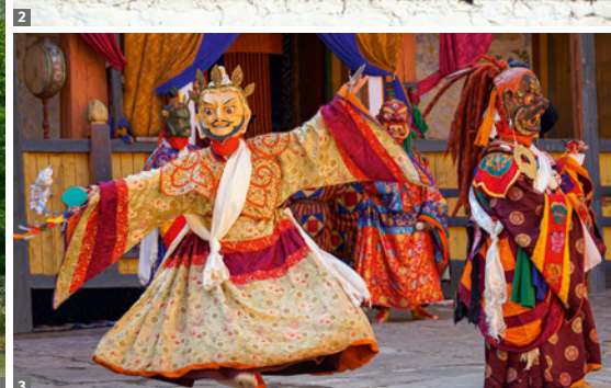
1 Punakha 2 Gebetsmühlen 3 Klosterfest