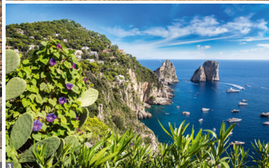
1 Pompeji 2 Fresken, Herculaneum 3 Capri

pia errichtet wurde, sowie den Tempel der Athene und des Poseidon, die erstklassig erhalten sind und exemplarisch für unterschiedliche Epochen des dorischen Baustils stehen.