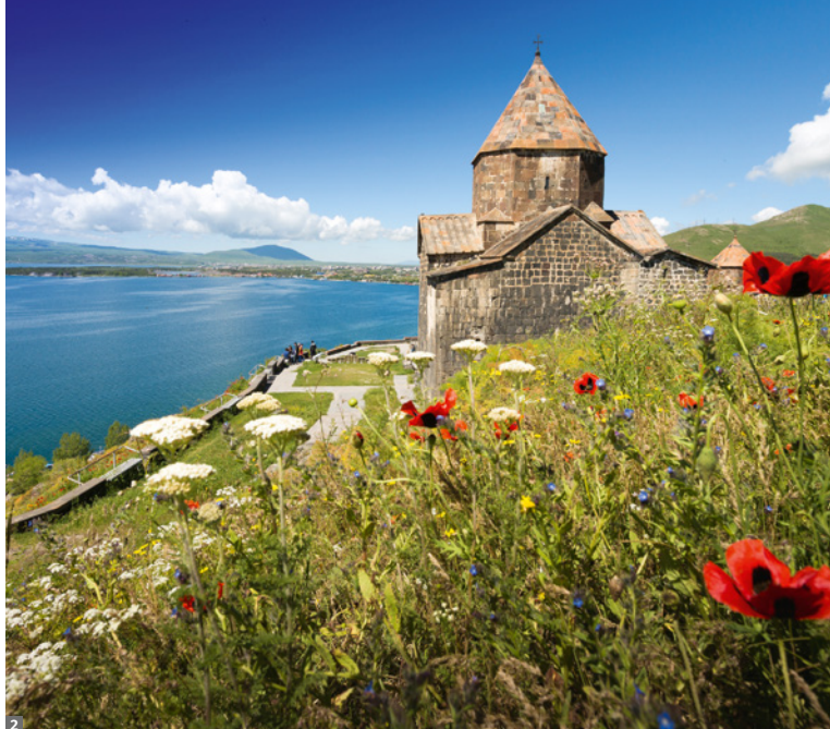
1 Garni-Schlucht 2 Kloster Sevanavank