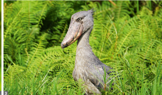
1 Berggorillababy © Dr. Harald Teubenbacher 2 Murchison Falls © Wibke Woyke / Alamy Stock Photo 3 Schuhschnabel © Dr. Harald Teubenbacher