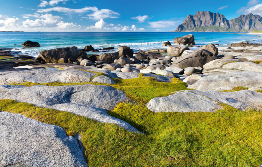
1 Insel Senja © Mag. Günter Grüner 2 Bauernhof am Fjord © Karl Hausjell 3 Nordkap © Karl Hausjell