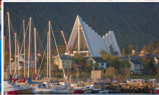
1 Fischerdorf 2 Alta, Felsritzungen 3 Tromsø