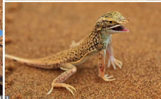
1 Spitzkoppe © Mag. Peter Brugger 2 Tsodilo Hills © Mag. Peter Brugger 3 Sandgecko © Mag. Peter Brugger