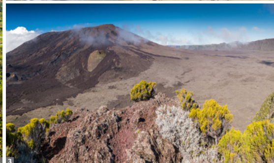
1 Cirque de Salazie 2 Saint-Denis, Kathedrale 3 Piton de la Fournaise