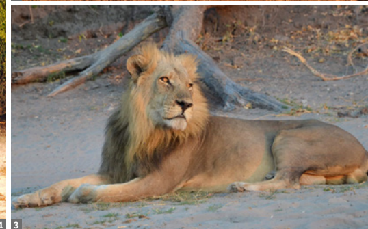
1 Elefantenbeobachtung am Chobe River 2 Twyfelfontein 3 Löwe im Chobe-NP

Rückfahrt in die Sesriem-Region: Wanderung in den schönen Sesriem Canyon mit fast senkrecht aufragenden Felswänden.