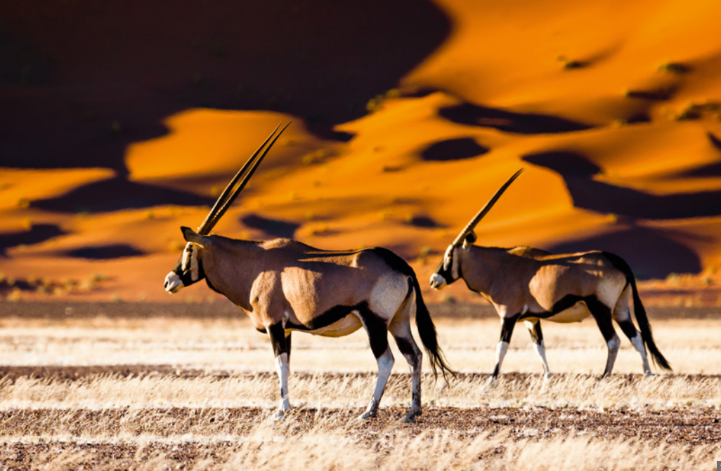
1 Oryx 2 Herero-Frau