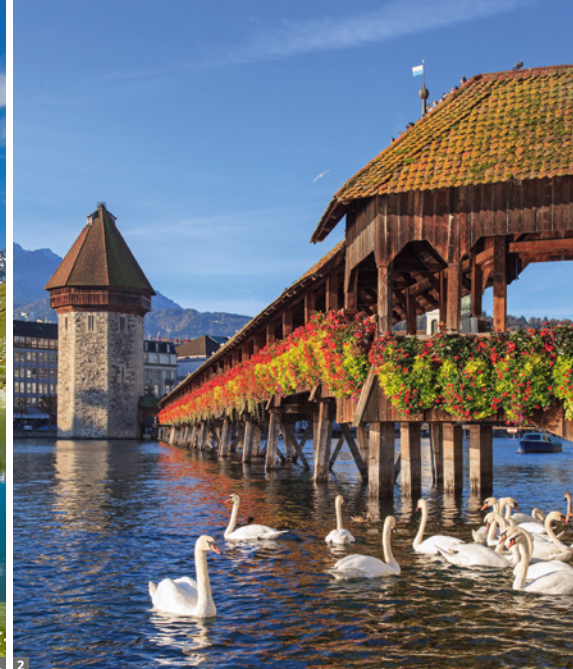
1 Matterhorn und Riffelsee 2 Luzern 3 Glacier Express

ca. CHF 126,-; bei Gruppen ab 10 Personen ca. CHF 88,20), einem der schönsten Aussichtspunkte der Alpen mit einem faszinierenden Rundblick auf Monte Rosa, Breithorn und Matterhorn (bei schönem Wetter kann man bis zu 27 Viertausender sehen). Bei der Rückfahrt Möglichkeit zu einer Kurzwanderung von einer Zwischenstation der Gornergrat-Bahn zum Riffelsee, von dem aus man das Matterhorn besonders gut - bei Wetterglück inkl. Spiegelung im See - sehen kann.