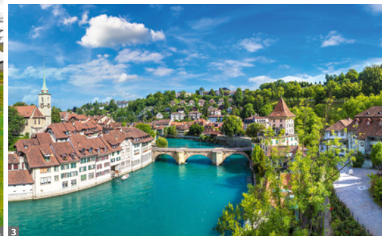
1 Kleine Scheidegg mit Mönch, Eiger, Jungfrau 2 Rheinfall/Schaffhausen 3 Bern