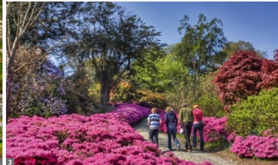
1 Rock of Cashel 2 Dingle, Slea Head Drive 3 Rhododendronblüte - Ende Mai/Anfang Juni