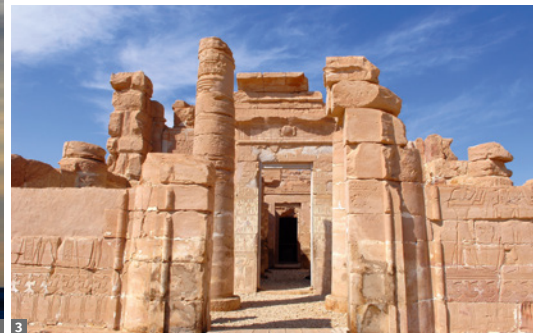
1 Weiße Wüste © Elisabeth Kneissl-Neumayer 2 Oase Bahariya © Elisabeth Kneissl-Neumayer 3 Deir-el-Hagar © Elisabeth Kneissl-Neumayer

Oase Dachla umfasst - dank zahlreicher Quellen (u.a. Thermalquellen) - ca. 16 Orte. Seit dem Alten Reich bestehen Beziehungen zum Niltal, ein Beispiel aus römischer Zeit ist der schöne Tempel Deir el Hagar sowie Gräber der Spätzeit.