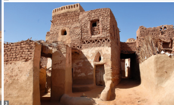
1 Weiße Wüste © Elisabeth Kneissl-Neumayer 2 Dachla, Gräber © Elisabeth Kneissl-Neumayer 3 Dachla, El Qasr © Elisabeth Kneissl-Neumayer