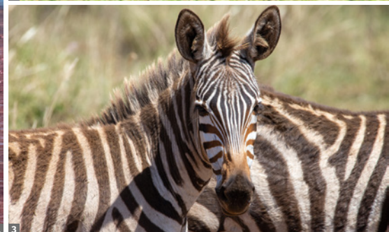
1 Flamingos am Lake Natron © Paul Souders / Danita Delimont - stock.adobe.com 2 © Prof. Sepp Friedhuber 3 Serengeti © Prof. Sepp Friedhuber