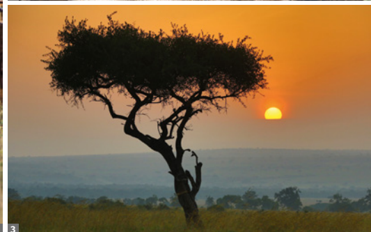
1 Pirschfahrt © Prof. Sepp Friedhuber 2 Leopard im Serengeti Nationalpark © Prof. Sepp Friedhuber 3 © Prof. Sepp Friedhuber

faszinierenden Landschaft des Rift Valley liegt. Bei einer Wildbeobachtungsfahrt erkunden wir die Tierwelt des Parks.