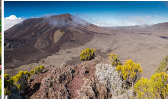
1 Cirque de Mafate 2 Siebenfarbige Erde bei Chamarel 3 Piton de la Fournaise