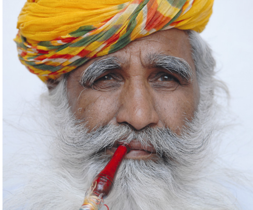
Jodhpur, Palastwächter