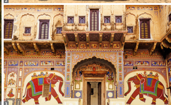
1 Udaipur 2 Frauen beim Wasserholen 3 Havelis in Shekavati