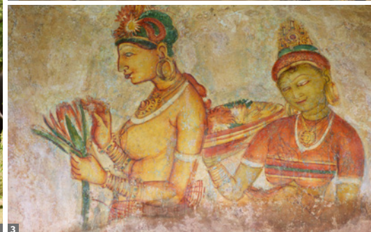
1 Minneriya 2 Dagoba, Anuradhapura 3 „Wolkenmädchen“

Devons und St. Clairs. Transfer zum Hotel in der Nähe des Flughafens - Abendessen. Das Hotelzimmer steht bis zur Abreise zur Verfügung. 11. Tag: Colombo - Doha - Wien/München/Frankfurt. Kurz nach Mitternacht Transfer zum Flughafen Abflug um ca. 04.55 Uhr nach Doha - Ankunft um ca. 07.25 Uhr. Weiterflug um ca. 09.45 Uhr nach Wien, München oder Frankfurt, wo man am frühen Nachmittag landet (ca. 14.35 Uhr).