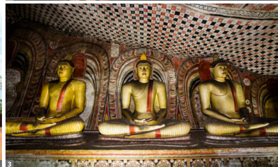
1 Sigiriya Festung 2 Kandy-Tänzer 3 Dambulla