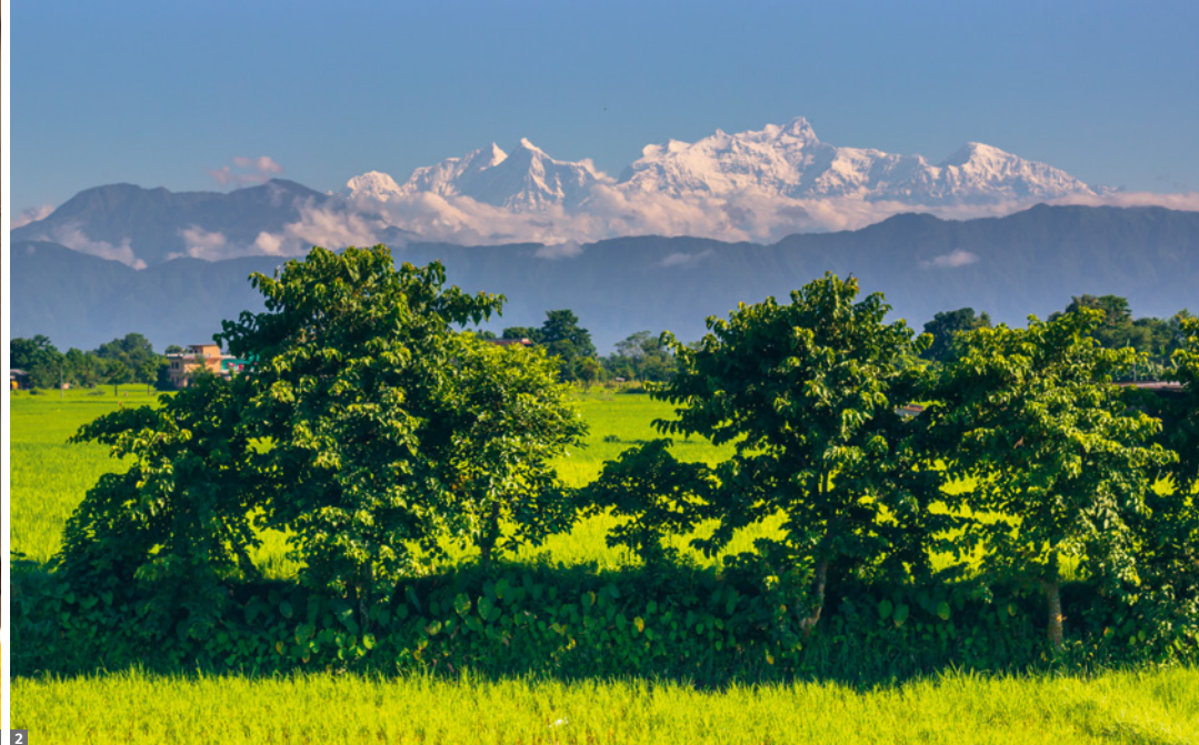
1 Sadhu in Pashupatinath 2 Blick über Chitwan-NP zum Himalaya