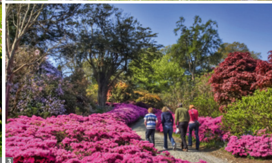
1 Irlands Westküste, Ring of Kerry 2 Burren, Poul nabrone Dolmen 3 Rhododendronblüte - Ende Mai/Anfang Juni