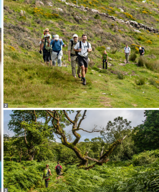
1 Connemara © Tourism Ireland 2 Wanderweg im Killarney NP © Dado Ibrakovic 3 Killarney NP © Dado Ibrakovic