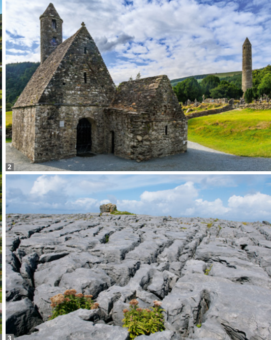
1 Killary Harbour 2 Glendalough 3 Burren

beeindruckendsten Karstlandschaften Europas, erwartet uns heute: Bei einzelnen kürzeren Wanderungen entlang des Burren Way sehen wir im Laufe des Tages faszinierende Karsterscheinungen - u.a. an der dramatischen Küste beim Black Head. Endlose typisch irische Steinmauern sowie faszinierende Zeugnisse von der Steinzeit bis ins Mittelalter - wie der Poulnabrone Dolmen und die Hochkreuze von Kilfenora - begleiten unseren Weg. (Gehzeit: total ca. 6 Stunden, ca. 16 km, 400 Höhenmeter↑, 300 Höhenmeter↓).