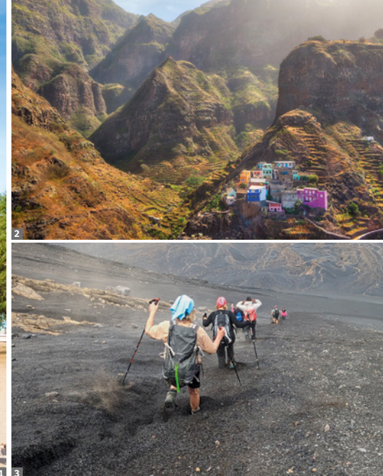
2 Santo Antão