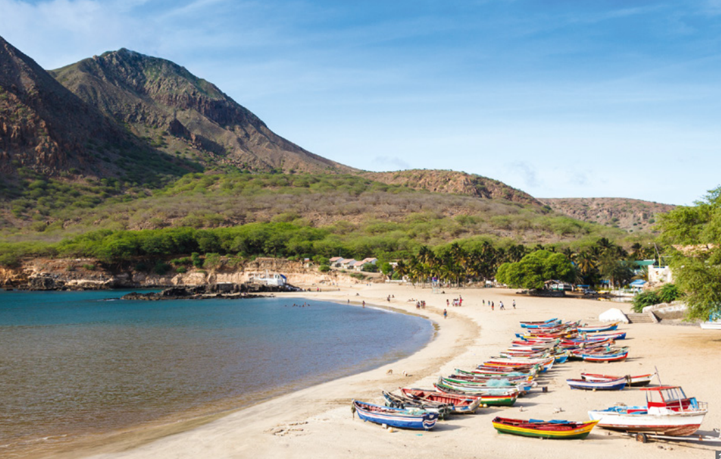
1 Tarrafal