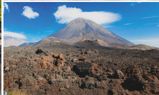
1 Santo Antão, Paúl Tal 2 Markt in Praia 3 Pico do Fogo