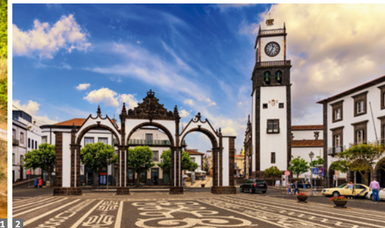
1 Sete Cidades © stock.adobe.com 2 Ponta Delgada, Portas da Cidade © stock.adobe.com