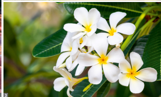
1 Siebenfarbige Erde bei Chamarel © istockphoto 2 Tempelanlage in Saint-Pierre auf La Réunion © istockphoto 3 Frangipani-Blüten © stock.adobe