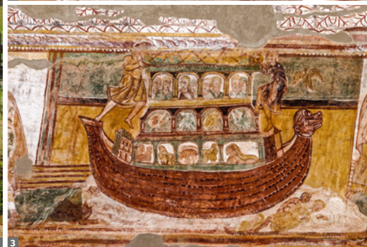
1 Saintes 2 Chauvigny Kapitell 3 Saint-Savin-sur-Gartempe, Fresken

teau über der Charente liegt. Hier sehen wir u.a. das Rathaus und die Kathedrale Saint-Pierre, bewundern aber auch die zahlreichen Wandmalereien - Angoulême gilt als Comic-Hauptstadt Frankreichs. Es geht weiter zum Château La Rochefoucauld - „Perle de l'Angoumois“, eines der schönsten Renaissanceschlösser Frankreichs. Einen Höhepunkt am Nachmittag bilden die außergewöhnlichen Hügelgräber (4700 v. Chr.) von Bougon. Am Abend erreichen wir schließlich Poitiers.