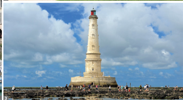
1 La Rochelle 2 Châtres 3 Leuchtturm Cordouan