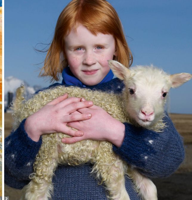
1 Námaskarð/Hverir, Mývatn 2 Isländisches Mädchen