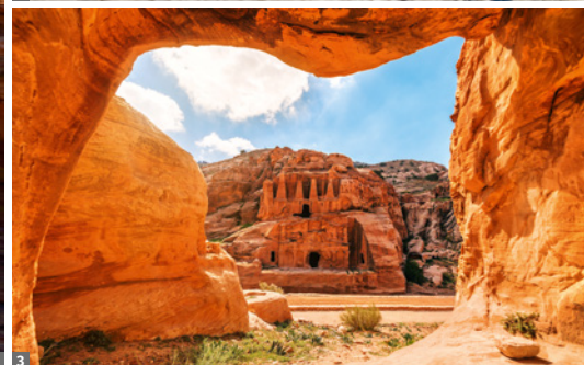
1 Wadi Rum 2 Totes Meer 3 Petra