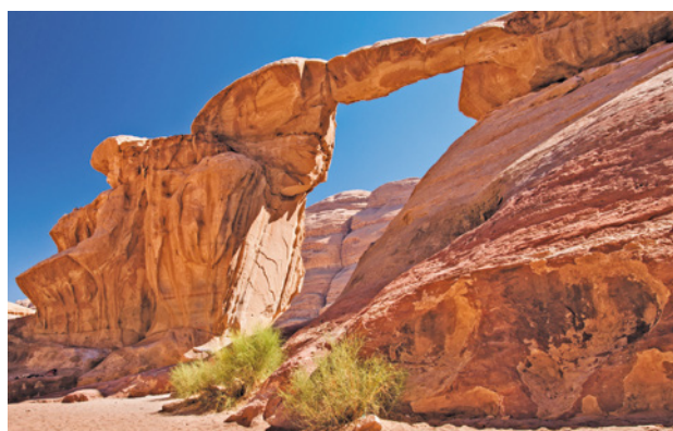
Wadi Rum, Um Fruth Naturbogen

2. Tag: Amman - Ausflug Jerash - Ajloun - Qalaat er-Rabad. Ausflug in das fantastische Jerash, wo wir die erstklassig erhaltenen Ruinen der