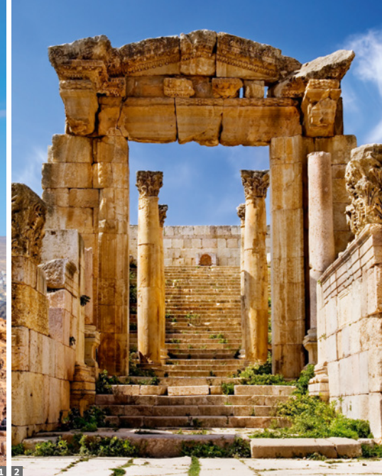
1 Petra, ed-Deir 2 Jerash, Artemis-Tempel

UNESCO-Welterbe al-Maghtas, die Taufstelle von Johannes dem Täufer (wenn möglich). Bei unserem Hotel besteht die Möglichkeit für ein Bad im Toten Meer.