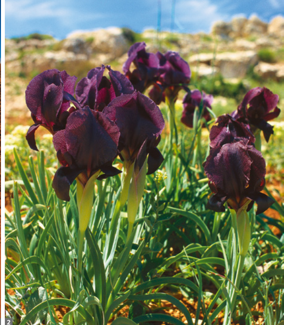
1 Wadi Rum 2 Schwarze Iris

ehemaligen römischen Provinzstadt Gerasa besuchen - einst Zentrum der Dekapolis/Zehnstädtebund: Wir sehen den Artemis-Tempel, die byzantinischen Kirchenruinen, das Nymphäum, die beiden Theater und spazieren über die Kolonnadenstraßen mit dem ehemaligen Teträpylon zum Südtor. Am Nachmittag Fahrt durch die Ajloun-Berge zur mittelalterlichen Festung Qalaat er-Rabad, von der wir eine gute Fernsicht genießen. Rückfahrt und Abendessen in einem der ältesten Falafel-Restaurants von Amman.