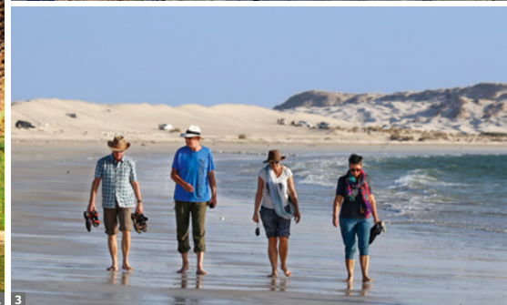
1 Wadi Shab 2 Jebal Shams 3 Sugar Dunes bei al-Khaluf