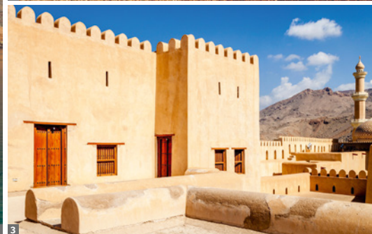
1 Dhowfahrt in den Fjorden von Musandam © Alamy 2 Wahiba Sands © Elisabeth Kneissl-Neumayer 3 Nizwa © Alamy Stock Photo

wässerungssystem (UNESCO-Welterbe) lernen wir in einigen Orten kennen. Wir wandern in das schöne Misfah mit seinen alten Steinhäusern und besuchen in al-Hamra mit seinen zahlreichen Lehmhäusern das traditionelle „Bait al-Safah“. Nach einem Fotostopp in Bahla, einer der ältesten Städte des Oman mit der Festung Hisn Tamah (UNESCO-Weltkulturerbe) bestaunen wir in Jabrin die schönen Innenräume der Festung. Am Abend erreichen wir schließlich Nizwa, die frühere Hauptstadt des Oman und religiöser Mittelpunkt des Landes.