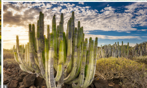
1 Masca 2 Garachico 3 Malpais

3. Tag: UNESCO-Welterbe Teide Nationalpark - Vilaflor - Besuch eines ökologisch geführten Weinguts. Heute lernen wir die Hochgebirgsregion im Zentrum der Insel kennen. Der Kraterkessel des Teide auf ca. 2000 m Höhe wirkt wie ein gigantisches Amphitheater mit einem Durchmesser von mehr als 17 km. Der Pico del Teide krönt diese beeindruckende Kulisse als höchster Berg Spaniens (3718 m). Während einer leichten Wanderung bleibt genügend Zeit, mehr über die Entstehungsgeschichte der Insel zu erfahren. Über die Südseite erreichen wir Vilaflor und besuchen dort ein ökologisch geführtes Familienweingut. Die Winzerfamilie weicht uns in die Besonderheiten des kanarischen Weines ein. Eine Degustation schließt sich nach dem Rundgang an. Gehzeit: ca. 2 Std., 50m ↑, 200m ↓, ca. 4,5 km