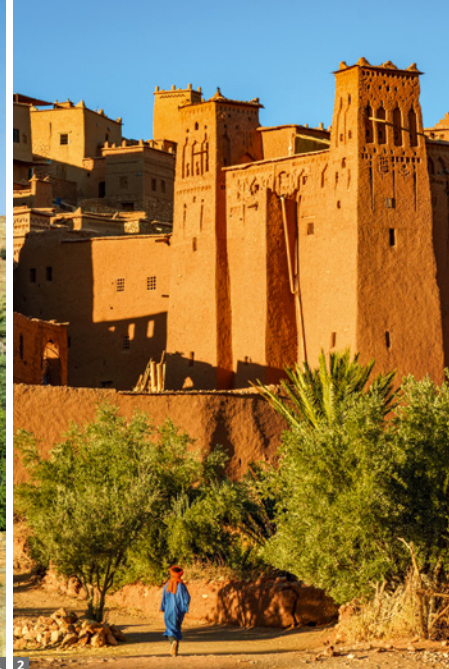
1 Tafraoute, Tal der Ammeln 2 Ait-Ben-Haddou

erzählern, Gauklern und Schlangenbeschwörern.