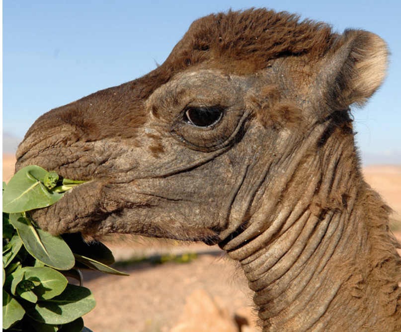
junges Kamel