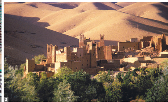
1 Atterine Medersa, Fès 2 Rabat Chellah 3 Dades-Tal

Souks und besticht mit einzigartigem Ambiente, u.a. bei der Grabmoschee des Stadtgründers Moulay Ismail.