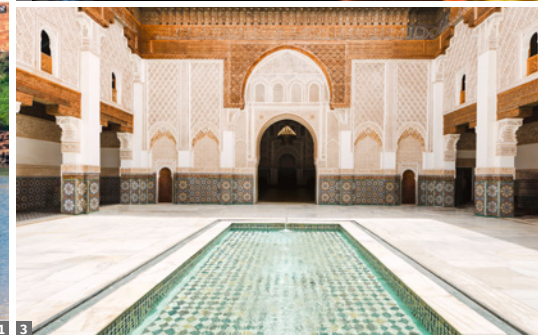
1 Rabat, Kasbah des Oudaïas © stock.adobe 2 Tajine © stock.adobe 3 Marrakesch, Medersa Ben Youssef © stock.adobe 4 Essaouira © Elisabeth Kneissl-Neumayer

7. Tag: Ausflug Essaouira (UNESCO-Welterbe)/Atlantikküste. Durch die Haouz-Ebene mit weiten Arganienbeständen (Stopp bei einer Frauenkooperative für Argan-Öl) fahren wir an den Atlantik nach Essaouira. Die Stadt, einer der malerischsten Orte des Landes, wurde 1506 von den Portugiesen als Mogador gegründet. Wir erkunden den Fischereihafen und die mauerumgürtete bezaubernde Medina - heute eine Stadt der Künstler - und steigen auf die Stadtmauer, um den herrlichen Ausblick zu genießen. Am Nachmittag Rückfahrt nach Marrakesch.