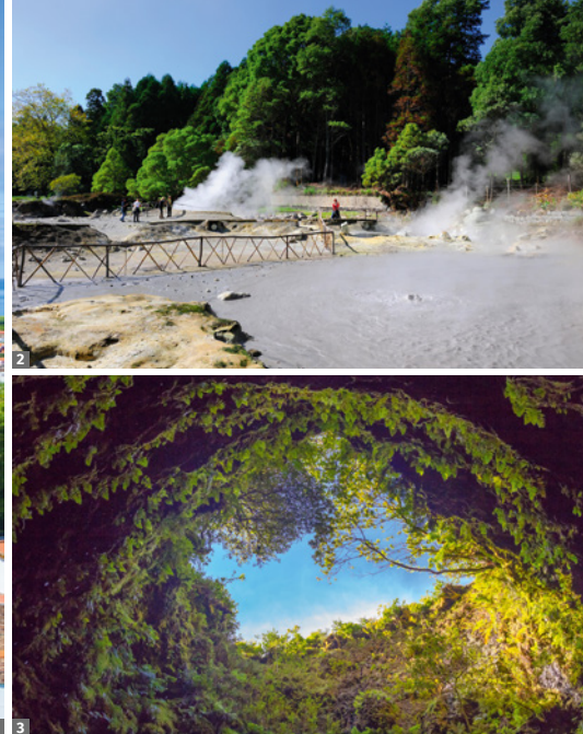
1 Angra do Heroísmo © stock.adobe 2 Furnas, vulkanische Aktivität mit kochendem Schlamm © Mauricio Abreu / Alamy 3 Gruta do Algar do Carvão © stock.adobe