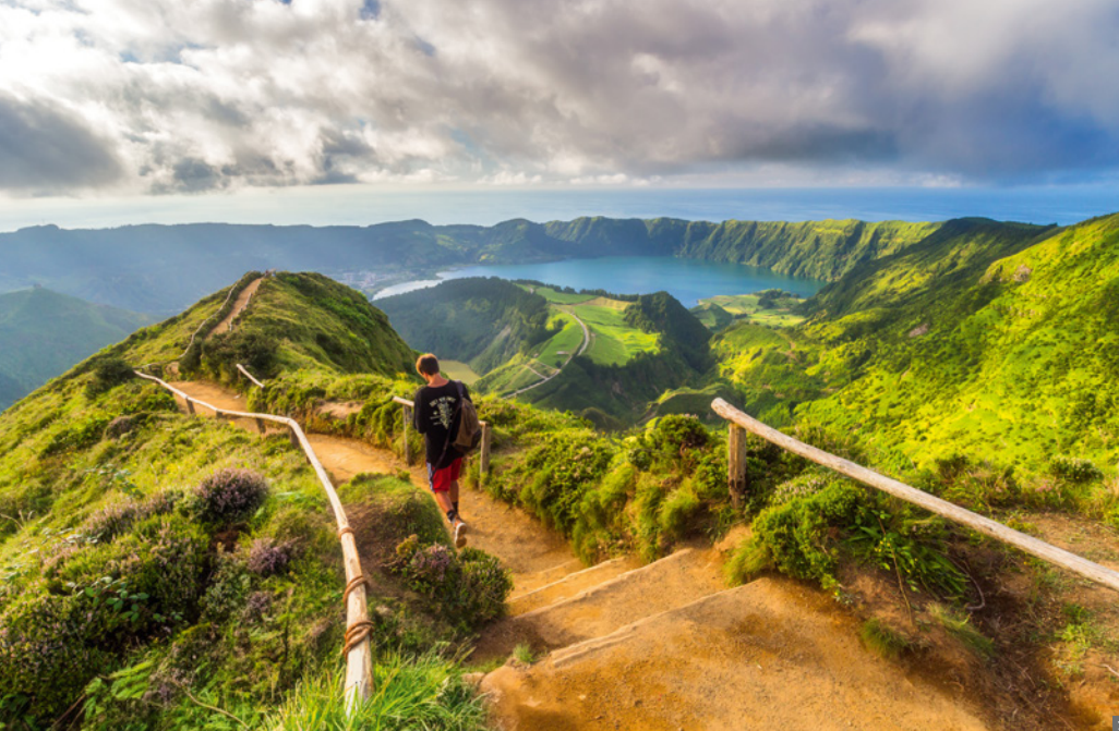
1 Sete Cidades © stock.adobe.com 2 Ponta Delgada, Portas da Cidade © stock.adobe.com