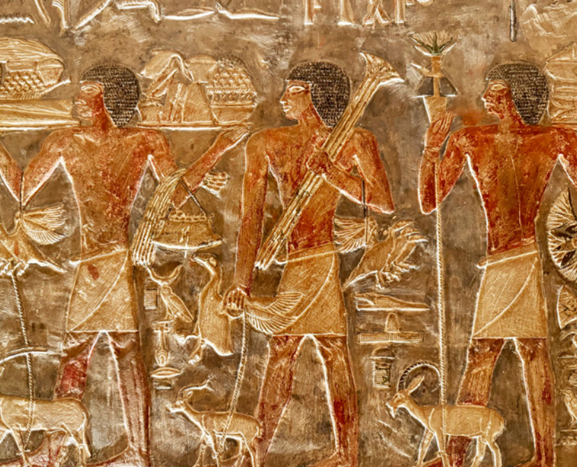
Sakkara, Grab des Mereruka © Elisabeth Kneissl-Neumayer