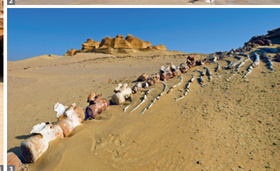
1 Kairo, Ibn Tulun-Moschee © Alamy Stock Photo 2 Grand Egyptian Museum © Alamy Stock Photo 3 Wadi al-Hitan © Alamy Stock Photo