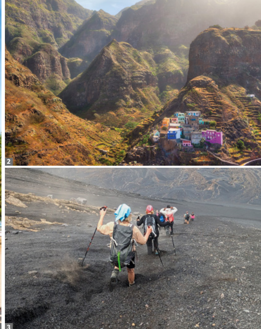
1 Tarrafal 2 Santo Antão 3 Abstieg vom Pico do Fogo

6. Tag: Mindelo - Santo Antão. Am Morgen Fährüberfahrt nach Santo Antão (ca. 1 Stunde). Über die bekannteste Passstraße der Kapverden, die Estrada da Cova, fahren wir von Porto Novo Richtung Norden zum Cova-Krater und genießen von einem Aussichtspunkt einen Blick in die schönste Caldera der Kapverden. Nicht minder eindrucksvoll ist die Weiterfahrt Richtung Delgadim, wo tief eingeschnittene Täler unvergessliche Fotomotive bieten. Über die Siedlung Ribeira Grande geht es in das gleichnamige „große Flusstal“ bis nach Coculi. Am Nachmittag unternehmen wir in einem Seitental eine Wanderung auf alten Pfaden, die zwischen den bepflanzten Terrassen und kleinen Bauernhöfen in mühsamer Arbeit angelegt wurden. Mais und Bohnen, beides wichtige Nahrungsmittel, werden hier angepflanzt; aber auch Zuckerrohr, aus dem der berühmte Grogue hergestellt wird. Danach kurze Fahrt zu unserer Unterkunft an der Nordspitze der Kapverden. Gehzeit: ca. 3 Std., ca. 7 km, moderate Wanderung, 200 m ↑ ↓.