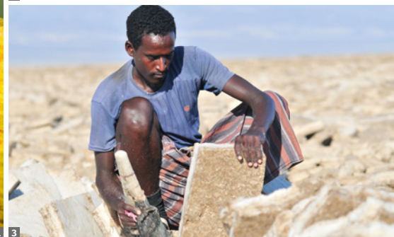
1 Sinterterrassen von Dallol 2 Awash NP, Gazellen 3 Salzarbeiter am Ass-Ale