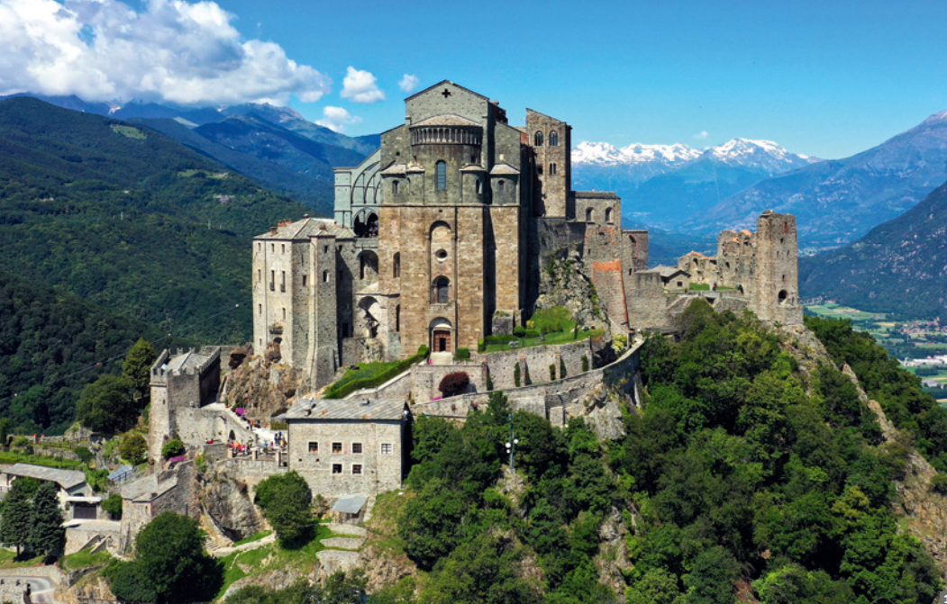
1 Sacra di San Michele © stock.adobe 2 Mont Blanc, Courmayeur © stock.adobe