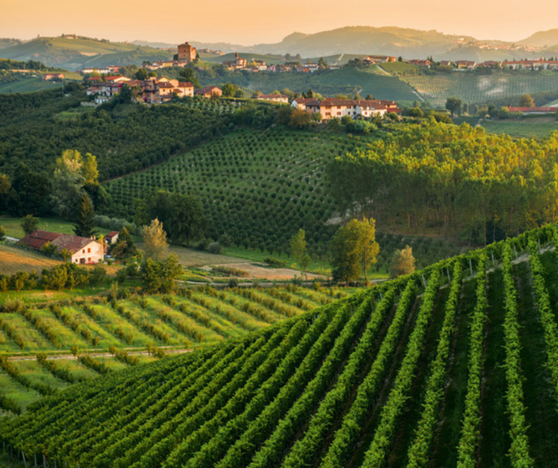
Weinberge Asti

metstadt Asti - wir besichtigen den Dom und die Stiftskirche des Heiligen Secondo.