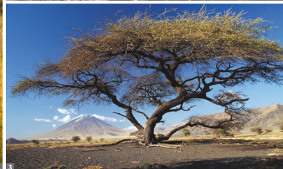
1 Jeepsafari 2 Geparden-Familie 3 Ol Doinyo Lengai Vulkan