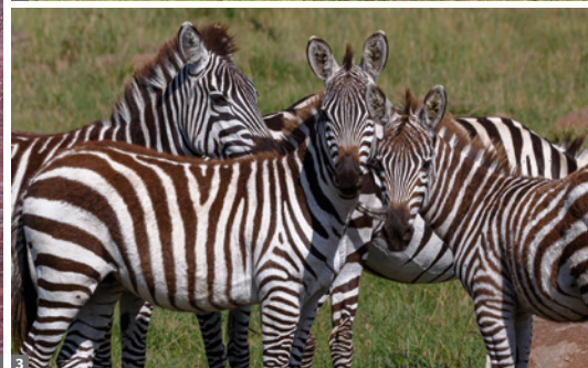
1 Flamingos am Lake Natron © stock.adobe.com 2 Gnuherde in der Serengeti © Prof. Sepp Friedhuber 3 Tarangire Nationalpark © stock.adobe.com

bestaunen authentische tansanische Kultur und erleben die Gastfreundschaft der Bewohner. Das Dorf ist bekannt für seine farbenfrohen Märkte, die Vielzahl lokaler Produkte, Kunsthandwerk und kulinarischer Delikatessen, zum Beispiel die köstlichen roten Bananen. Übernachtung in der Safari Lodge am Rande des Tarangire NP.