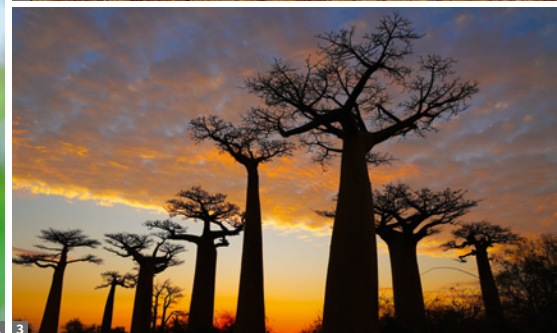
1 Sifaka 2 Fenster von Isalo 3 Baobab Allee