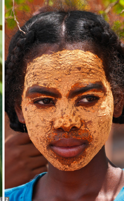
2 Sonnenschutz