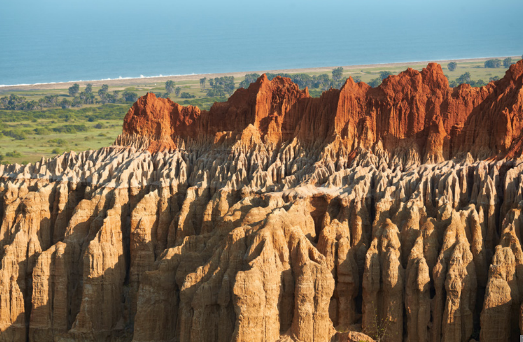
1 „Miradouro da Lua“ mit Ausblick auf die bizarre Mondlandschaft