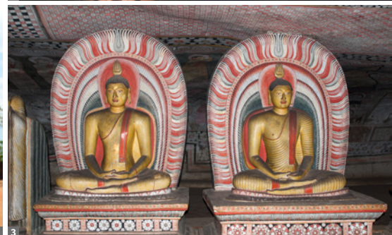
1 Sigiriya Festung 2 Kandy-Tänzer 3 Dambulla