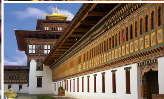
1 Thimphu Tsechu © stock.adobe.com 2 Kathmandu © stock.adobe.com 3 Paro Dzong © stock.adobe.com