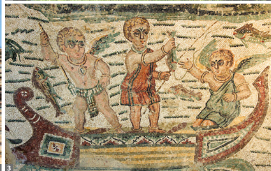
1 Agrigento, Tal der Tempel 2 Syrakus, Latomien 3 Villa Romana del Casale

spazieren über einen der Märkte und sehen die Kathedrale mit ihrer fantastischen Fassade aus dem 12. Jh. Unser nächstes Highlight ist die herausragende Cappella Palatina im ehemaligen Normannenpalast, ein weiteres einzigartiges Relikt aus der Normannenzeit in Sizilien - viele bezeichnen sie als „Bilderbuch in Gold“. Sie wurde als Teil der Residenz von Roger II. im 12. Jh. überschwänglich ausgestaltet. Den Abschluss des Tages bilden die schöne Kirche San Cataldo (UNESCO-Welterbe) sowie ein Spaziergang durch die lebhaften Straßen bis zum Teatro Massimo.