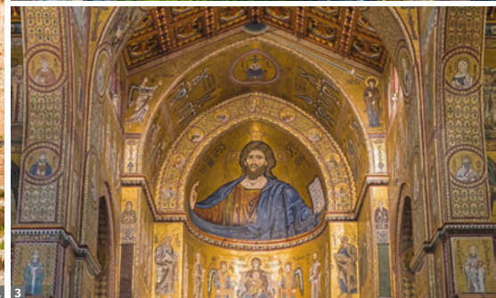
1 Taormina, Theater mit Ätna 2 Noto 3 Monreale