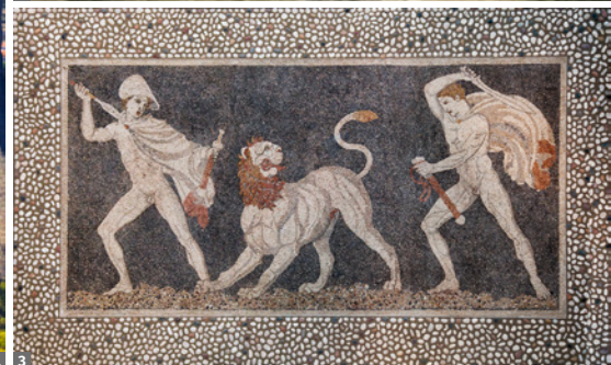
1 Meteora-Kloster 2 Bootsfahrt Berg Athos 3 Pella, Mosaik