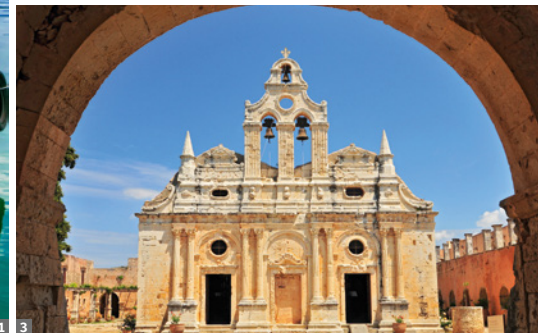
1 Rethymnon 2 Knossos, Fresken im minoischen Palast 3 Kloster Arkadi