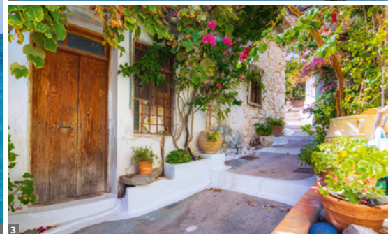
1 Spinalonga 2 Rethymnon 3 Kritsa

stätte des Politikers und Freiheitskämpfers Eleftherios Venizelos - der Ausblick auf Chania ist herrlich. Anschließend Stadtbesichtigung von Chania: Wir sehen die San Francesco Kirche, einen dreischiffigen, gotischen Bau aus dem 14. Jh., die Janitscharen-Moschee, den venezianischen Hafen, den Kastelli-Hügel und die Altstadt.