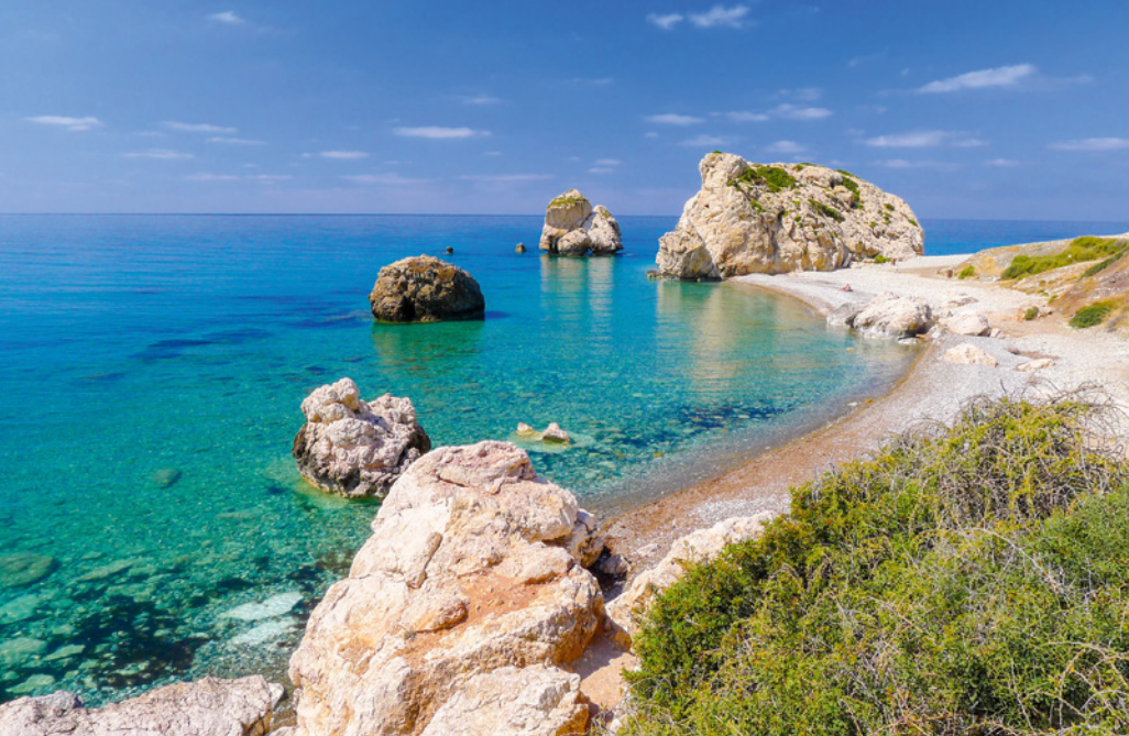
Petra tou Romiou

in einer urigen Taverne im Dorf Kathikas. Wanderung ca. 11 km/ca. 4 Std., ca. 450 m ↑, 350 m ↓.