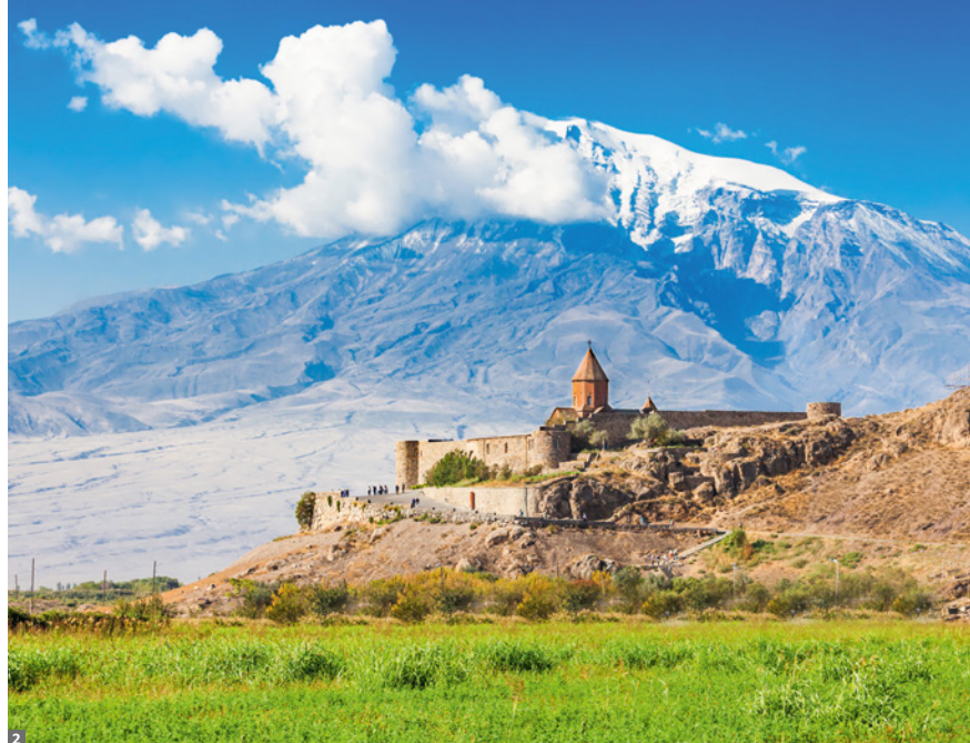
1 Garni-Schlucht 2 Kloster Chor Virap