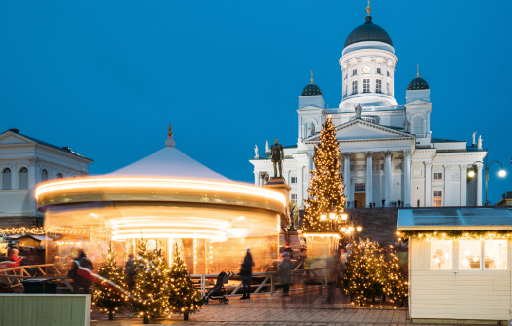
1 Helsinki, Weihnachtsmarkt 2 Porvoo